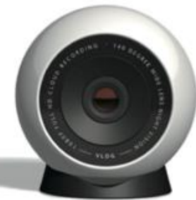
VLOG CAM VCC-1

また、VLOGサービスのB2Cビジネス向けおよびB2Bビジネス向けのパートナーとして、株式会社アイ・オー・データ機器(以下、アイ・オー・データ)、富士ソフト株式会社(以下、富士ソフト)と協業することで合意いたしました。